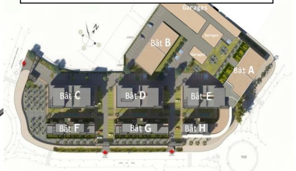
Maison de santé